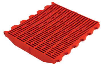
Pieza rejilla wean to finish