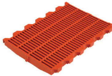
Pieza rejilla destete

Medidas: 600x200, 600x300, 600x400 y 200x600