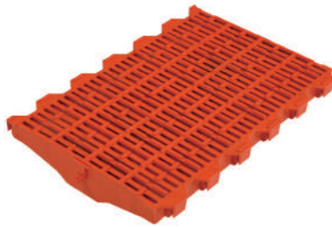
Pieza rejilla madres

Medidas: 600x200, 600x300, 600x400 y 200x600